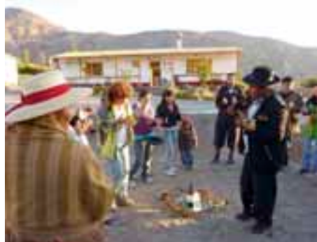
Einweihung des Museums

Detaillierte Informationen finden Sie auf der Homepage der Stiftung unter Projekt-Nr.: 016.