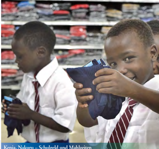
Kenia, Nakuru – Schulgeld und Mahlzeiten