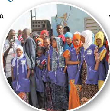
Senegal, Waoundé – Berufsausbildungszentrum

vom Staat zum Prüfungszentrum befördert. Das heißt, es kommen jetzt Schüler und Lehrer aus anderen Landesteilen an das Zentrum, um ihre Prüfungen abzulegen. Dies bedeutet Anerkennung und somit Unterstützung für das Zentrum und auch einen Entwicklungssprung für die Region. Allen Unterstützern herzlichen Dank!