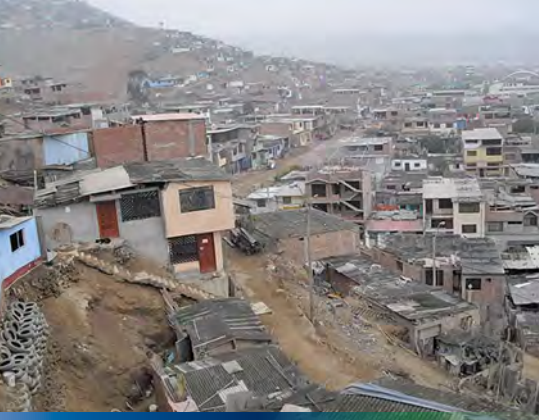
Peru, Lima – Begegnungsstätte