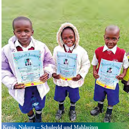
Kenia, Nakuru – Schulgeld und Mahlzeiten

Das Berufsausbildungszentrum in Waoundé im Département de Kanel ist ein wichtiger Baustein um jungen Menschen eine Zukunftsperspektive zu geben und somit auch die Region wirtschaftlich zu stärken. Die „Selbsthilfegruppe der Bürger Waoundés e.V.“ betreut das Zentrum. Seit 1997 wird das Projekt in Senegal von der Georg Kraus Stiftung begleitet. Nun wurde es