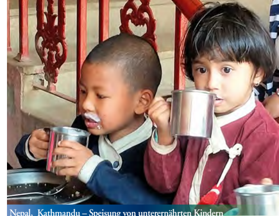
Nepal, Kathmandu – Speisung von unterernährten Kindern