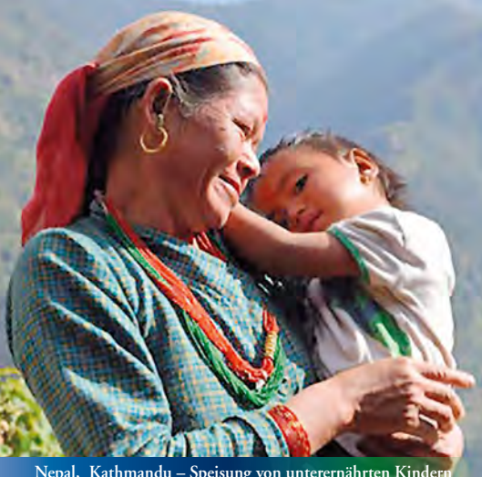
Nepal, Kathmandu – Speisung von unterernährten Kindern